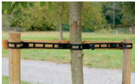
2 attaches – longueur 810 mm