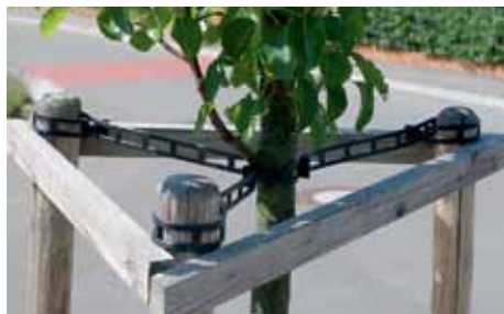
3 attaches – longueur 630 mm