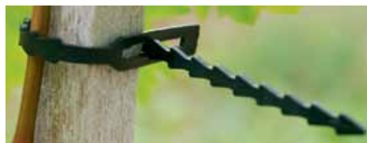
Plastoband Longueur 180 mm