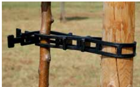
1 attache – longueur 810mm

Sac 30mm de largeur 630 mm de longueur de 50 pièces + pièces intermédiaires N° d'article 1910 Sac de 810 mm de long de 50 pièces + pièces intermédiaires N° d'article 1920 Sac spécial pour 50 pièces intermédiaires N° d'article 1930