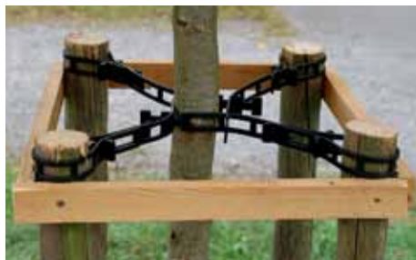
4 attaches – longueur 810

Ces attaches Baumband sont utilisées pour la fixation d'arbres bordant les routes ou composant les allées. Leur conception robuste permet d'attacher rapidement tout type et toute taille d'arbre. Les attaches Baumband sont fabriquées en polyéthylène non-polluant et résistent aux UV, ce qui fait qu'elles se conservent des décennies durant.