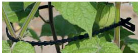
Plastoband Longueur 430 mm

Plastoband , l'attache idéale pour la ligature de plantes en espalier, jeunes arbres, pieds de vigne, arbustes, tomates fleurs, baies etc. Comme fermeture pour sachet ou ligature de câbles dans l'industrie.